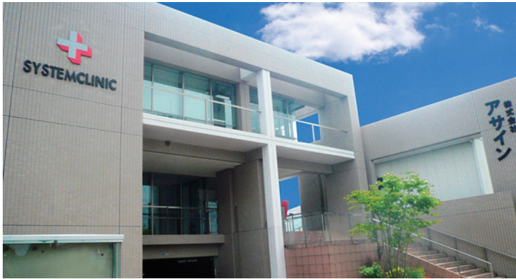
茨城県ひたちなか市の本社社屋です。