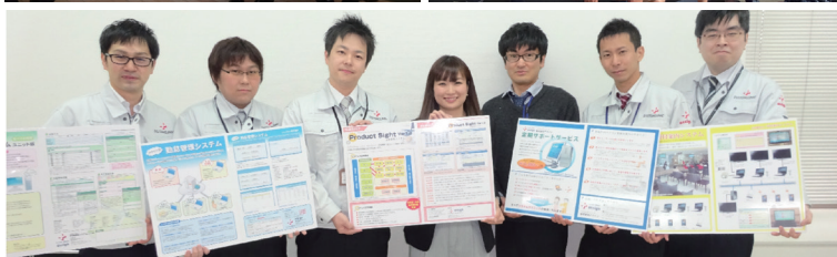
頼れる優しい先輩たちがたくさんいます。

当社の強みはお客様のIT環境をまるごとサポート出来るということです！自社パッケージソフト開発、受託システム開発、ハード販売、ネットワーク構築、ホームページ制作、給与会計ソフトの導入支援など、窓口1本で企業のお客様のIT業務をトータルサポートできる体制を有しています。また「幅広い業種・業態のエンドユーザーに対応できる技術力」も当社の特長です。多業種のお客様との出会いから積み上げてきたノウハウと信頼が私達の大きな武器となっています！様々な製品開発にもチャレンジしています。お客様の「こんなソフトあったら便利！」という一言から始まるプロジェクトが沢山ありお客様目線のものづくりを実践しています。